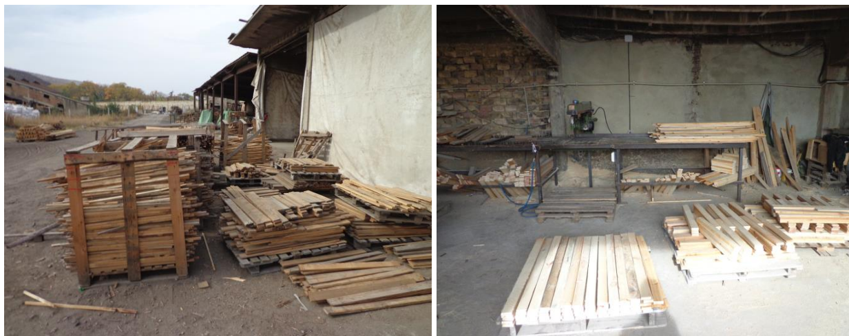
Цех за сглобяване на палета в ЗО „Разделна“

Настанените лица в ЗО „Разделна“ са включени още на доброволен труд и в домакинския щат на обекта.