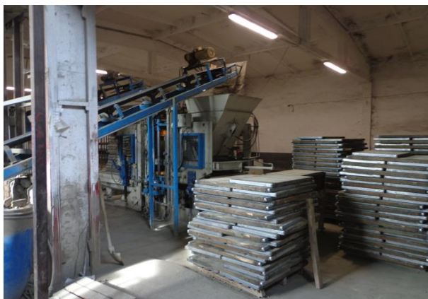
Цех за бетонни изделия в ЗО „Разделна“

Обектът разполага с работна зона, в която има цех за сглобяване на палети и цех за бетонни изделия.