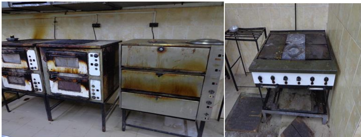
Електроуреди в кухнята на Затвор Варна

Предвид горното омбудсманът на Република България отправя отново препоръка до началника на Затвор Варна да се извърши ремонт на кухнята и да бъдат подменени наличните електроуреди в нея във възможно най-кратък срок.