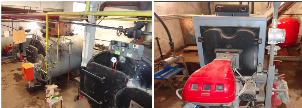
Котелното помещение в Затвор Варна

Котлите се намират в отделна сграда и са под постоянен технически надзор.