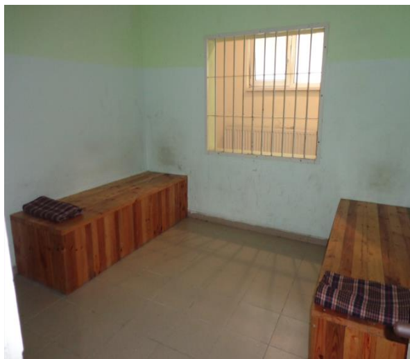
Помещение за настаняване на пълнолетни