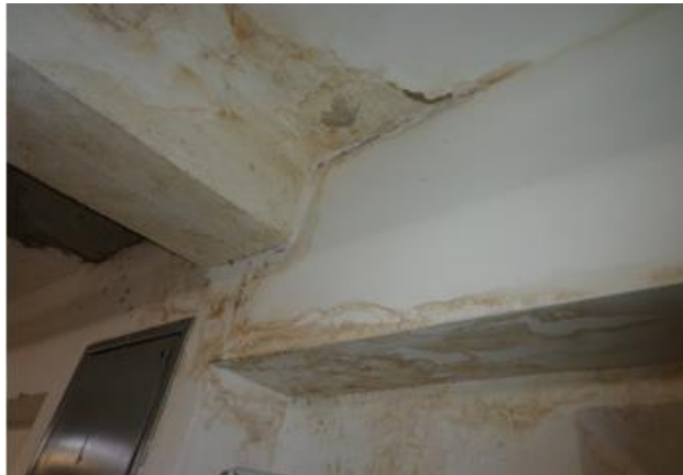
Видими следи и щети, причинени от течове

Някои от подовите по коридорите са от метални плоскостности, които са корозирали, изгнили и с образувани отвори на места, от които може да се види долния етаж .