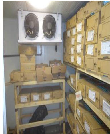
Хладилни камери в складоводо помещение (включително за риба)