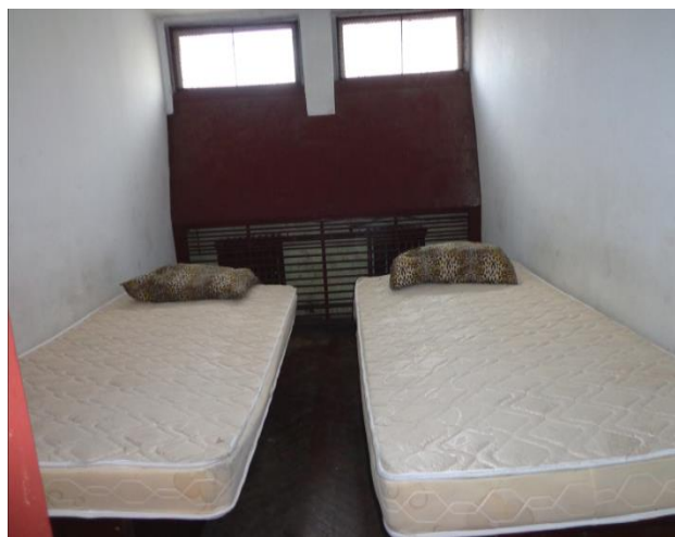
Помещение за настаняване на пълнолетни

До помещението за настаняване на пълнолетни има санитарен възел, който се ползва от задържани мъже. Жените ползват санитарния възел на горния етаж, който се ползва и от служителите на полицейското управление.