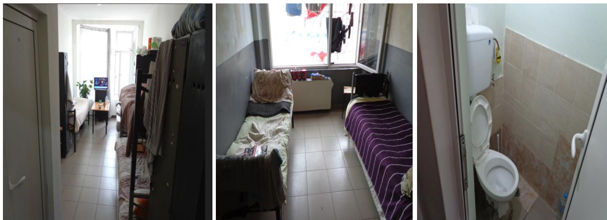
Стаи за настаняване и санитарен възел в ЗО „Разделна“

Сред лишените от свобода е ангажирано едно лице, което пръска в помещенията с препарати за дезинфекция (срещу КОВИД-19 и други заразни болести).