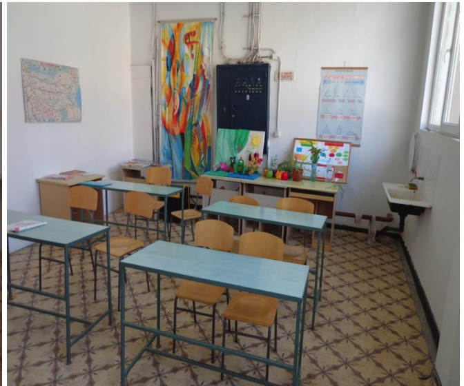
Класни стаи в училището на затвора

Затворът Варна разполага още с театрален салон, библиотека и християнски параклис, където лишените от свобода могат да прекарват свободното си време.