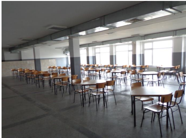
Столовата в ЗО „Разделна“

Затворническото общежитие разполага и със собствена лавка, откъдето лишените от свобода могат допълнително да си закупуват продукти според техните нужди.