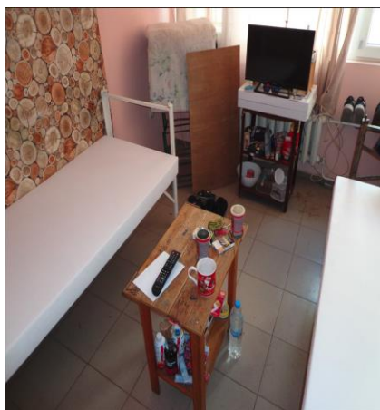
Стая за настаняване