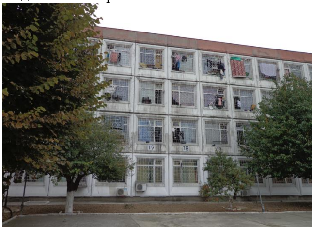
Сградата на ЗО „Разделна“

Затворническото общежитие се помещава в една сграда, съставена от партер и три етажа. Лишените от свобода са настанени от първия до третия етаж, като първите два етажа са от открит тип, а последния е от закрит тип.