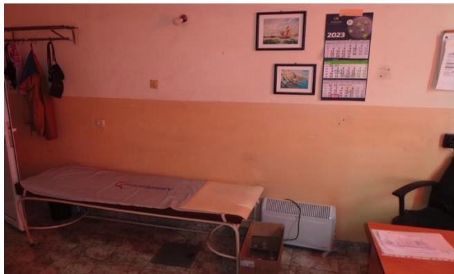
Лекарският кабинет в Затвор Варна

Лекарският кабинет разполага с всички необходими средства за оказване на първа помощ, а непосредствено до него е стаята за съхранение на лекарствени продукти.