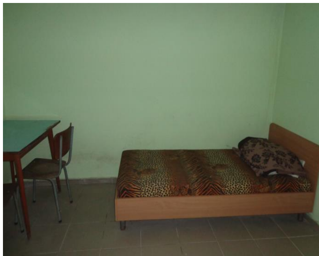
Помещение за настаняване на непълнолетни

На видно място е поставен Правилника за вътрешния ред в полицейското управление и актуален списък на дежурните адвокати към Адвокатска колегия – Варна. Обявен е и телефонът на Националното бюро за правна помощ.