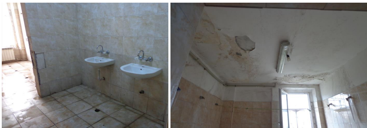
Обща баня в ЗО „Разделна“

Всеки етаж разполага с обща баня, в която лишените от свобода се къпят съобразно График за ползване на затворническата баня, утвърден със заповед на началника на ЗО „Разделна“. Графикът е съобразен с разпоредбите на чл. 151, ал. 1, т. 3 от ЗИНЗС.