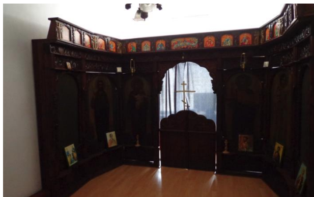
Параклис в ЗО „Разделна“

ЗО „Разделна“ разполага със своя библиотека, в която лишените от свобода могат да прекарват част от свободното си време. На втория етаж от сградата има православен параклис, който редовно се посещава от вярващи лишени от свобода.