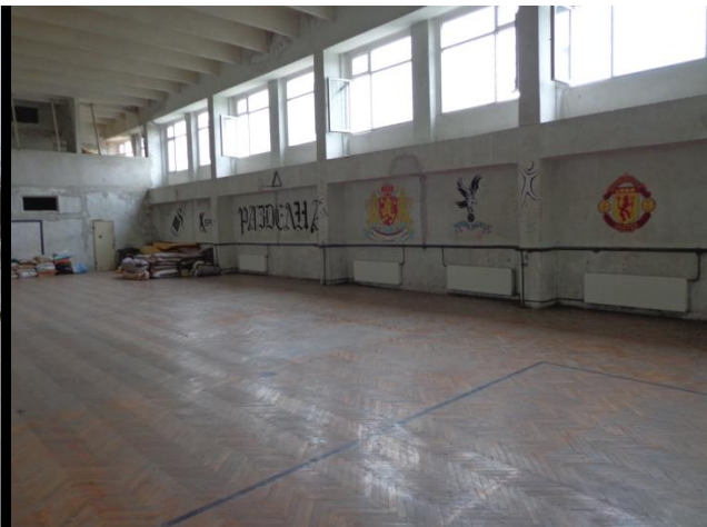
Физкултурен салон в ЗО „Разделна“

Обектът има и физкултурен салон, в който се провеждат спортни игри между настанените лица. В двора на общежитието има игрални площадки и фитнес уреди, където може да се спортува и да се прекарва време навън.