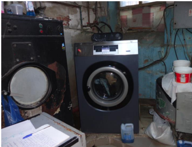
Пералното помещение в Затвор Варна