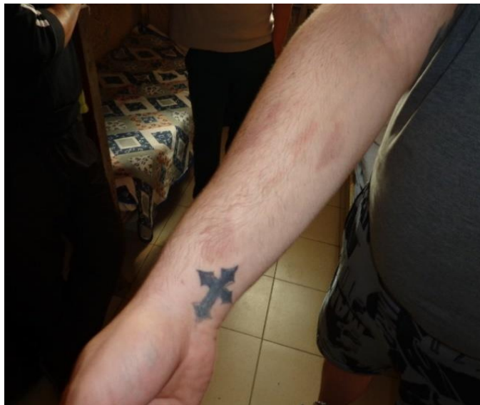
Следи от ухапвания от дървеници