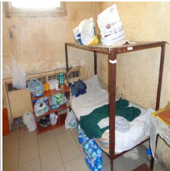
Спално помещение в ареста