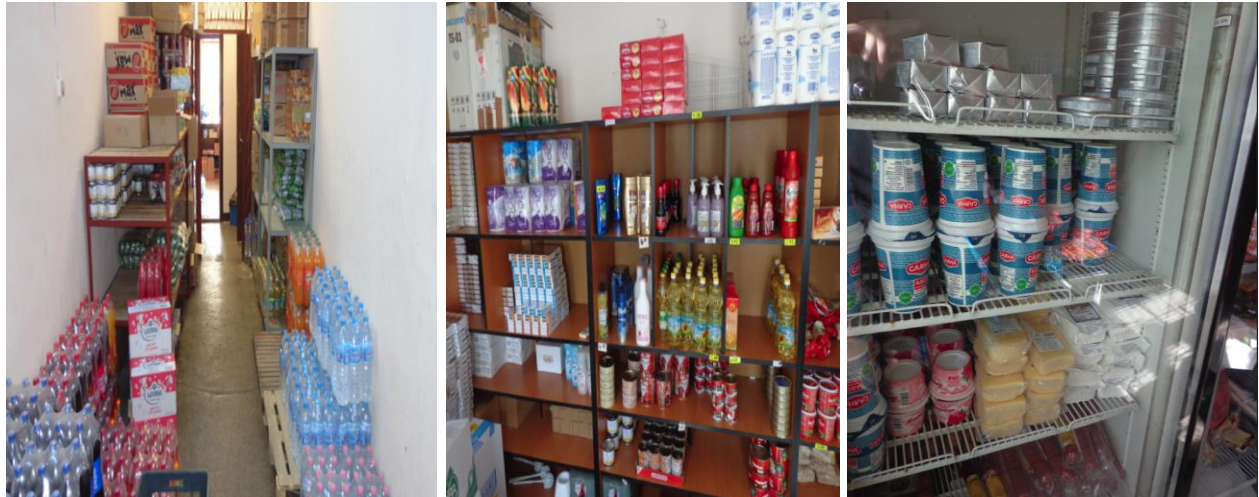
Продукти в лавката в Затвор Варна

Търговският обект е снабден с разнообразни хранителни продукти, напитки и тоалетни принадлежности. Продуктите, за които се изисква да бъдат съхранявани на ниски температури, са разпределени в хладилни камери.