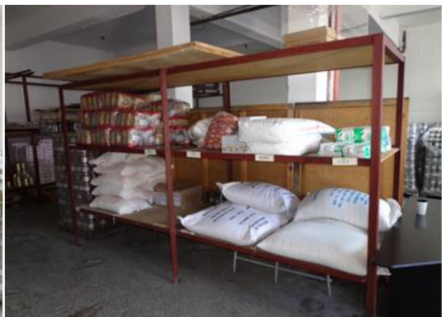
Пакетирани хранителни продукти в склада на Затвор Варна

Складът е добре поддържан, редовно се чисти и по време на проверката не беше констатирано наличие на хлебарки и други вредители в него.