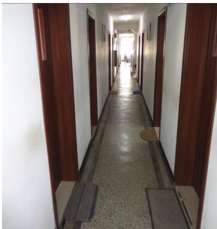
Общ коридор в общежитието

Видео-охранителната система функционира нормално като обхваща основните зони и места за пребиваване. Затворническото общежитие е в добро материално състояние, разполага със стаи за настаняване на лишени от свобода, столова, библиотека и дворно място с фитнес уреди в него.