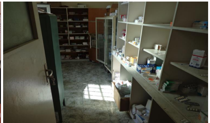
Складът с лекарствени продукти

Работещият на място лекар организира работата си съобразно нормативните изисквания и съгласно работния си график. Задължителната медицинска документация беше изискана и проверена, като е констатирано, че е пълна и се води редовно. В