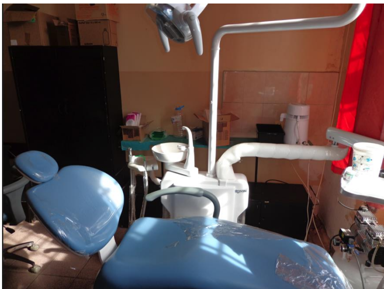
Стоматологичният кабинет в Затвор Варна

Медицинският център разполага и със стоматологичен кабинет, който е оборудван с необходимата апаратура, инструменти и материали.