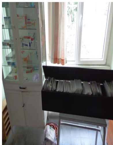
Спешен шкаф с лекарства