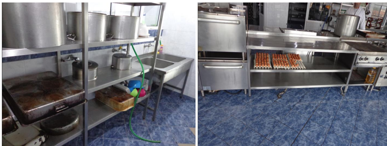
Кухнята в ЗО „Разделна“

Лишените от свобода са доволни от храната, която се сервира и нямат оплаквания от нея.