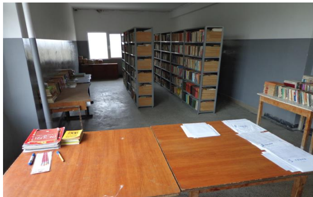
Библиотека в ЗО „Разделна“