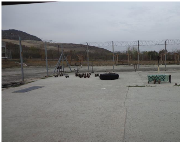
Двор в ЗО „Разделна“