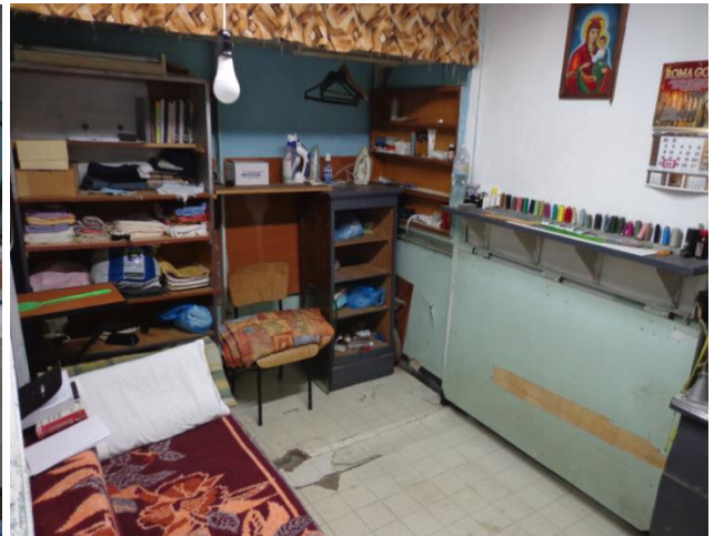
Шивачницата в Затвор Варна