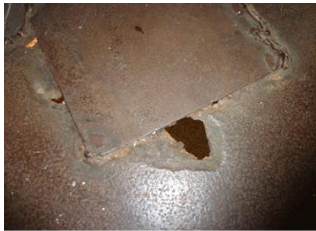
Подовите по някои от коридорите на затворническия корпус

Омбудсманът в качеството си на НПМ многократно е отправял препоръки за справяне със системния проблем с наличието на хлебарки и дървеници в местата за лишаване от свобода. Въпреки тези препоръки, проблемите с вредителите продължават да бъдат налични и да не се предприемат необходимите и ефективни действия за трайното справяне с тях.