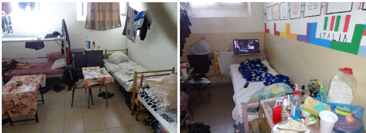
Спални помещения (килии)

Къпането се извършва от понеделник до събота съобразно график за почасово използване на баня от лишените от свобода в Затвор Варна, утвърден от началника на затвора, в сила от 18.10.2022 г. Графикът за къпане е съобразен с изискванията на чл. 151, ал. 1, т. 3 от ЗИНЗС.