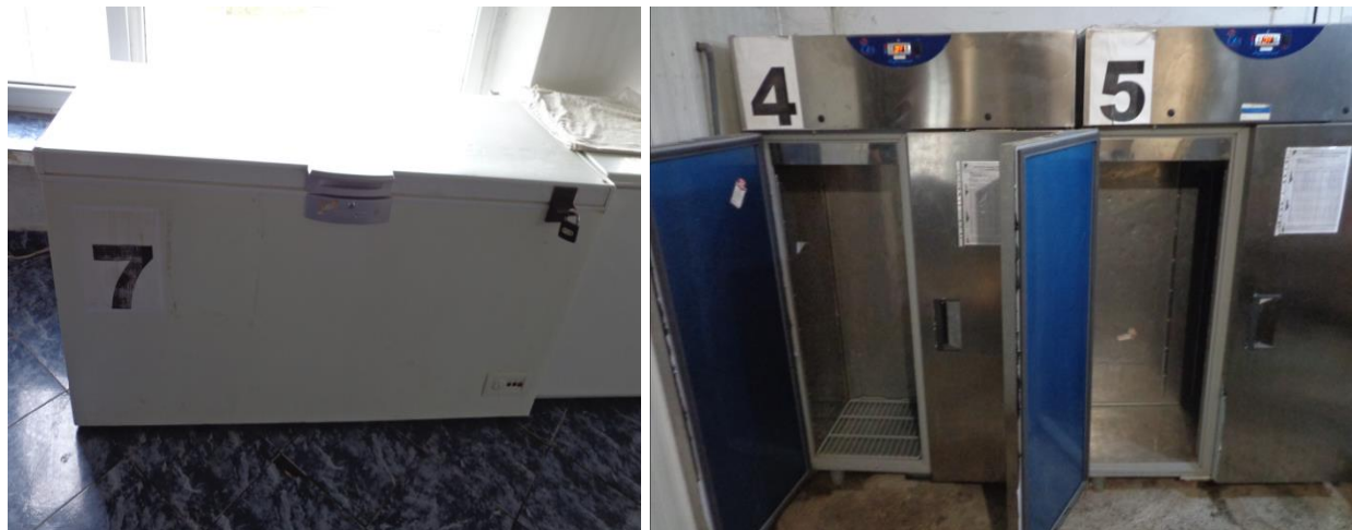
Хладилни камери в ЗО „Разделна“

Общежитието разполага със складове, които са оборудвани с различни камери за месо, риба, млечни продукти и други видове храни, които задължително следва да бъдат съхранявани при ниски температури.