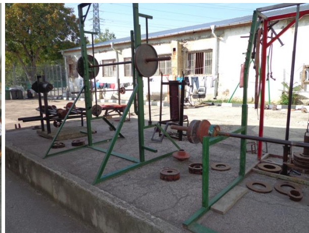
Място за фитнес и престой на открито