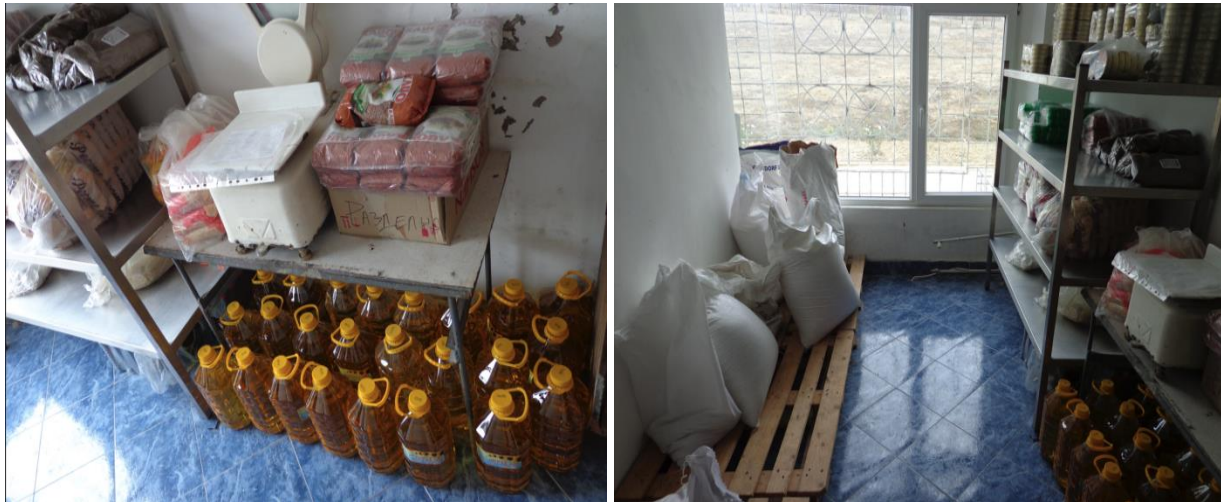
Складово помещение за хранителни продукти в ЗО „Разделна“

Кухнята на затворническото общежитие е оборудвана с необходимите уреди и техника. Храненето се извършва съгласно утвърдения график за разпределяне на времето. Храната, която се приготвя и сервира в ЗО „Разделна“ е разнообразна, като са предвидени и различни диетични менюта, съобразно здравословното състояние или вероизповеданието на лишените от свобода. За работещите лишени от свобода се осигуряват допълнителни хранителни надбавки.