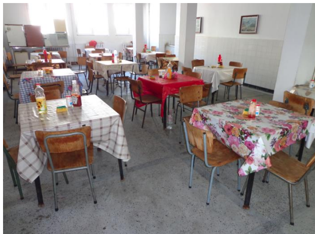
Столова на общежитието

Освен в библиотеката на общежитието, настанените в него лица имат възможност да спортуват в двора, който е обзаведен с фитнес уреди, имат и възможност да провеждат видеоконферентна връзка с близките си съобразно утвърден график.