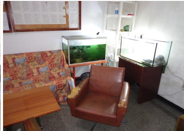
Кът за отдих

Библиотеката на общежитието е обзаведена предимно с художествена литература. Съхраняваните в нея книги са основно стари издания, но в добро състояние. Настанените в Затворническо общежитие „Варна“ се грижат и за домашни любимци в обекта като аквариумни рибки и костенурки.