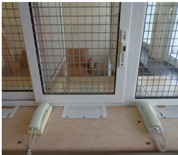
Стая за свиждане

Арестът се помещава на последния етаж от сградата. На първия етаж се помещават стаята за свиждане, адвокатска стая и стая за разследващи полицаи.