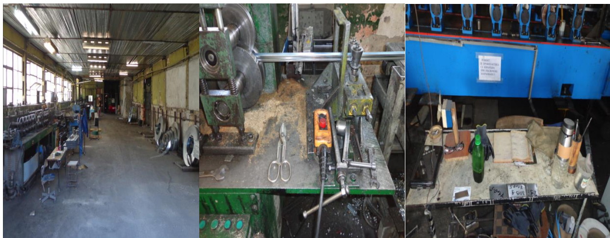
Цехът в Затвор Варна

На територията на Затвор Варна има цех за изработка на метални профили за гипсокартон. Обектът е оборудван с всички необходими материали и са осигурени безопасни условия на труд за лишените от свобода, които работят в него.