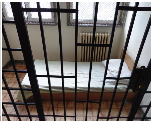
Помещение за настаняване на непълнолетни